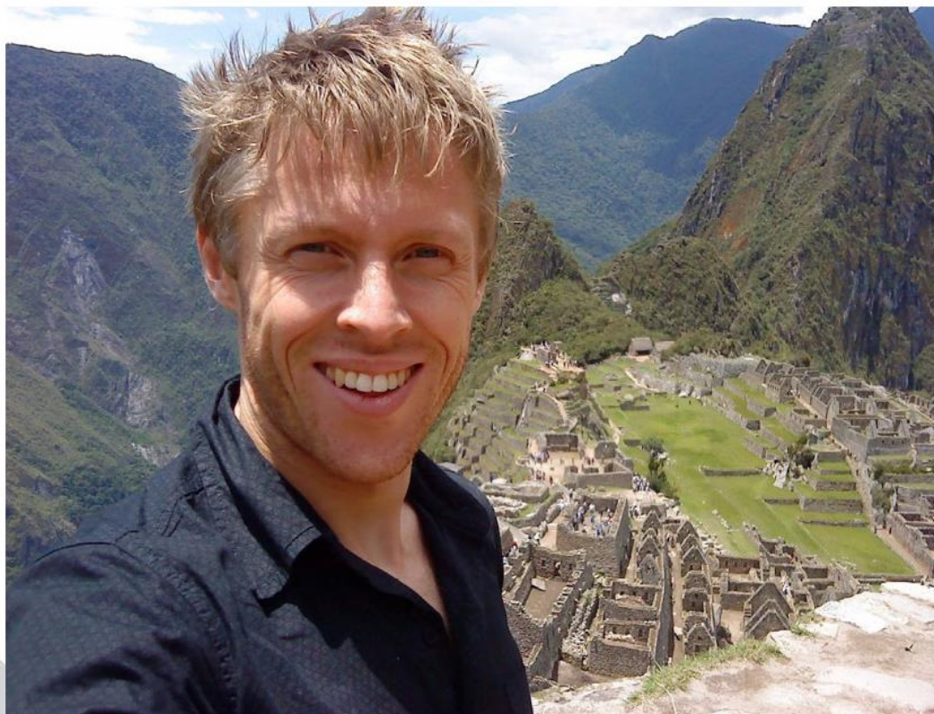
Gunnar Garfors i Machu Picchu i Peru, ein av verdas vakraste byar, fritt og høgt til fjells.

Sunnfjordlaget 100 år Sunnfjordlaget var sist ut av dei tre innflyttarlaga våre, men ville ha vore 100 år i år om det var eige lag framleis.